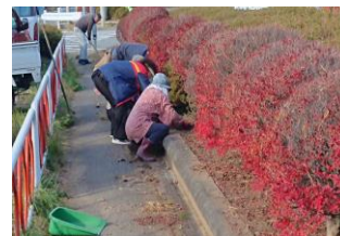
六工花壇環境整備 (11/18)