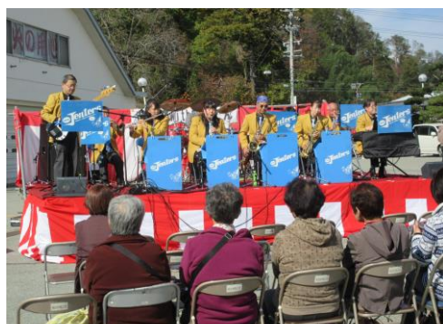
会場を盛り上げるニュージェンターズ