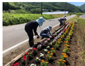
老人レクリエ ーションセン ター花植え (6/13)