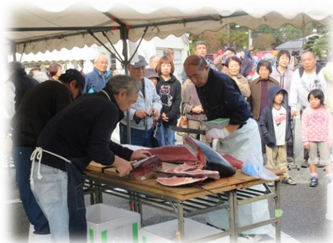
今年もいい本マグロだ！！