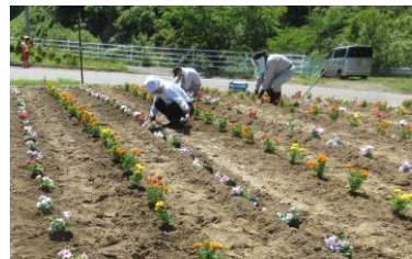
小仁熊花壇 花植え (6/13)