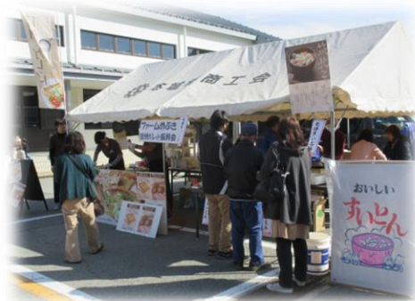
今回初出店ファームめぶき