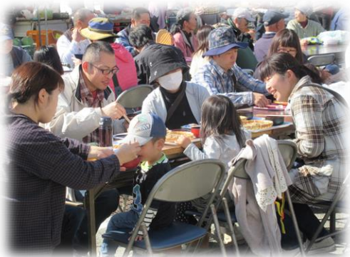
晴天の下でそばをいただきました

第10回商工祭（旧商工そば祭り）が、11月3日（日）筑北村役場駐車場において開催されました。当日は、朝から晴天に恵まれ、穏やかな中大勢の皆様にご来場いただきました。また、今年も引き続き、「でんでんフェスタ」との同時開催となりイベントに華を添えてくれました。