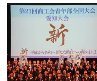
12月4日～5日、山田青年部長は じめ5名で参加してきました。