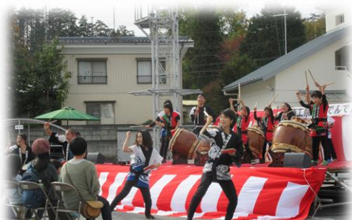
四阿屋こだま太鼓の皆さん