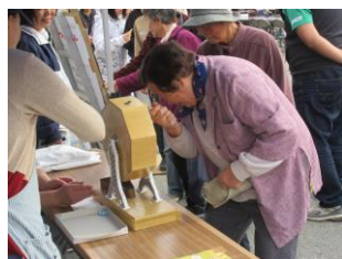
特賞当たりますよう