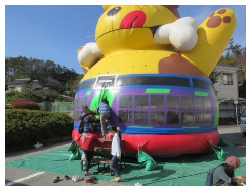
子どもに大人気ファアファ！！